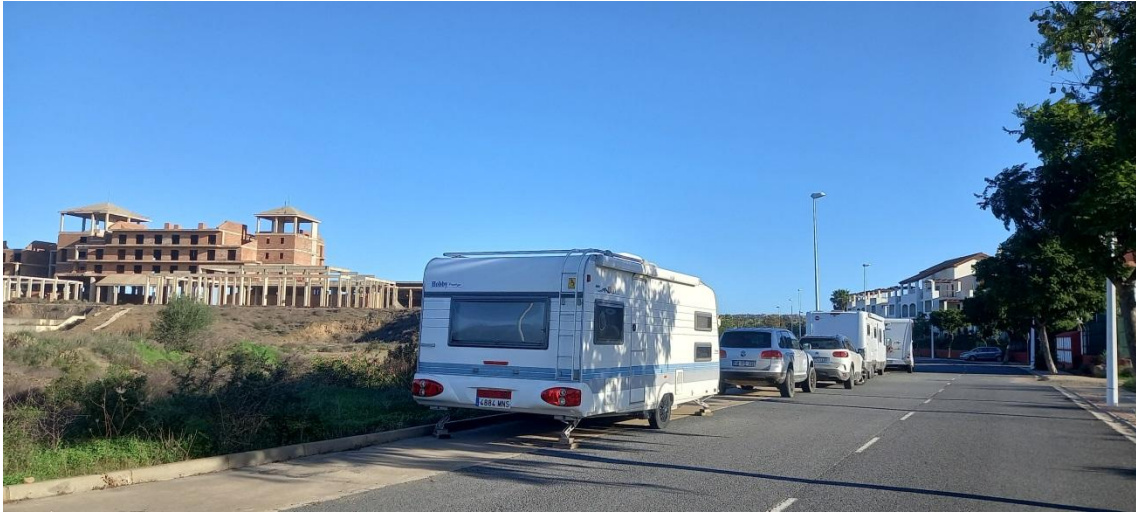
Avda. Juan Pablo II: