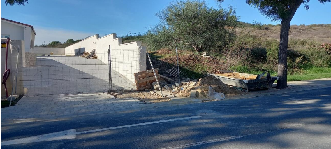
Desperfectos por obras en zona común