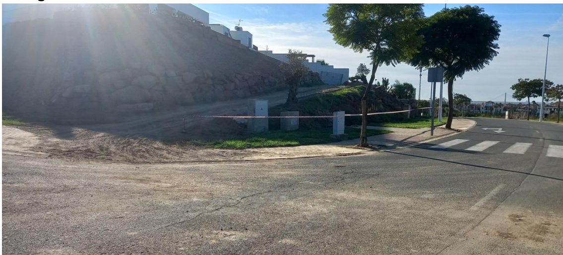
Cerramiento de zona común por obras