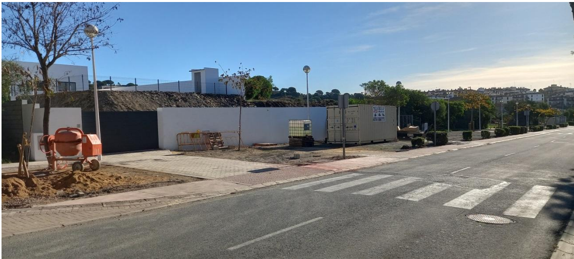
Caseta de obra en zona común