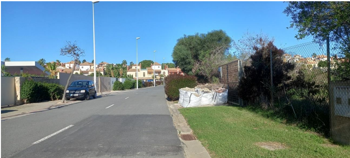
Escombros de obra en zona común