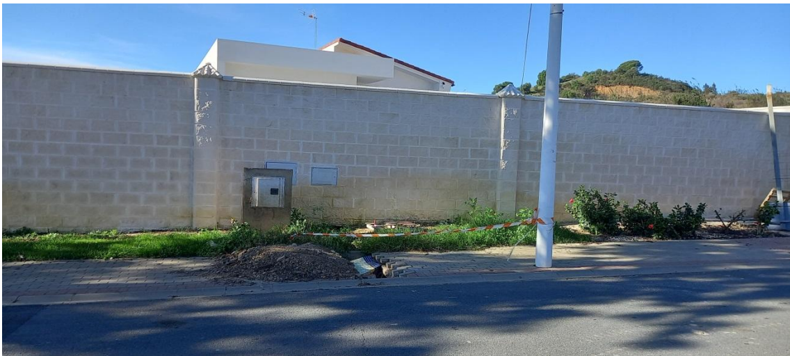
Desperfectos por obras en zona común