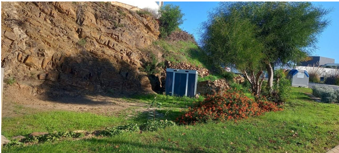
Caseta privada en zona pública