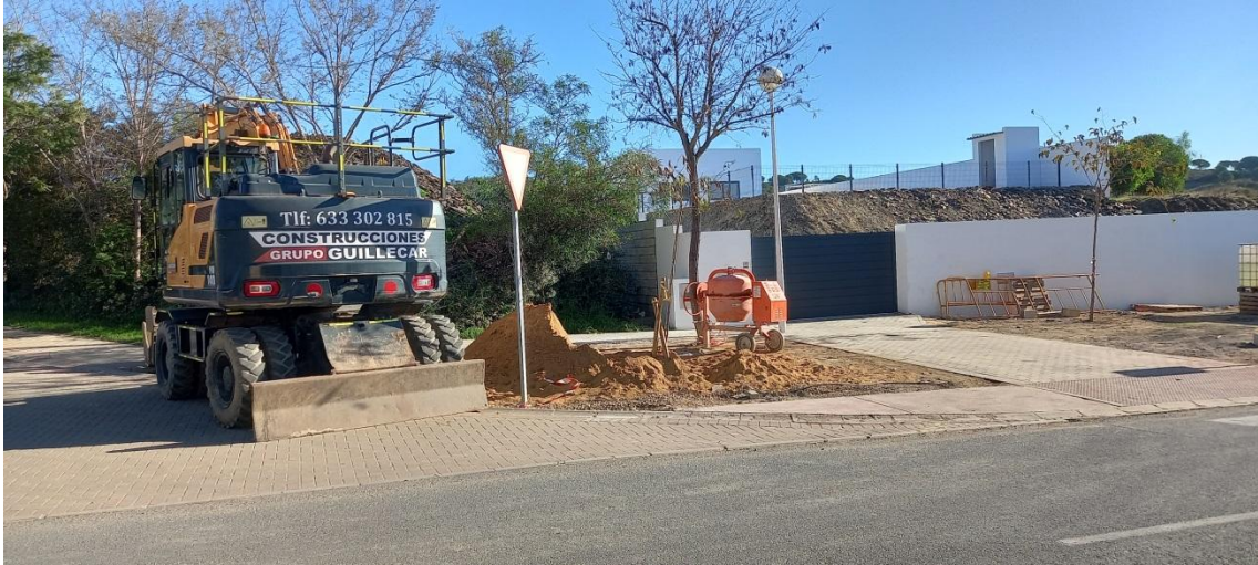
Máquina en zona común