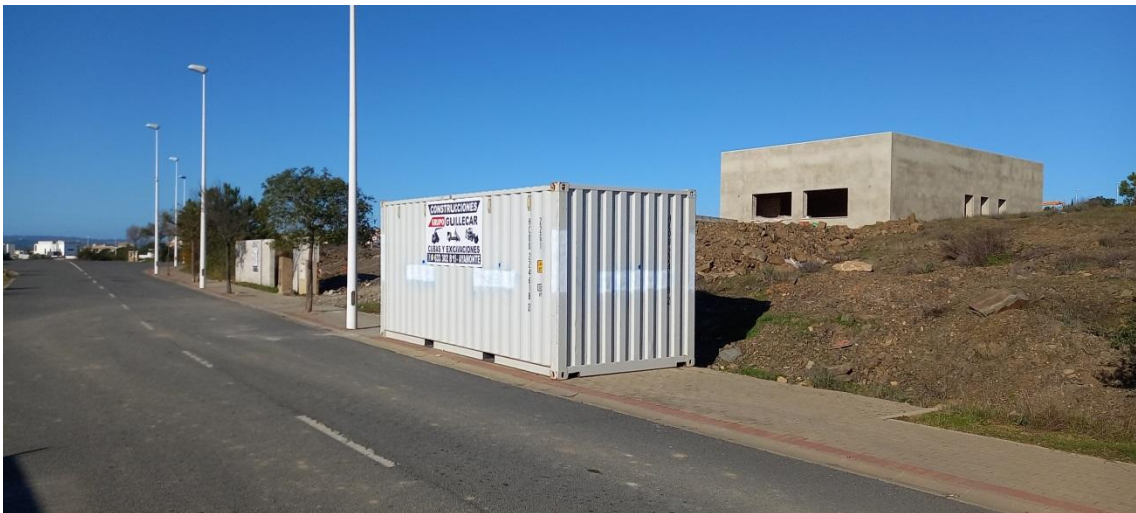
Caseta de obra en zona común