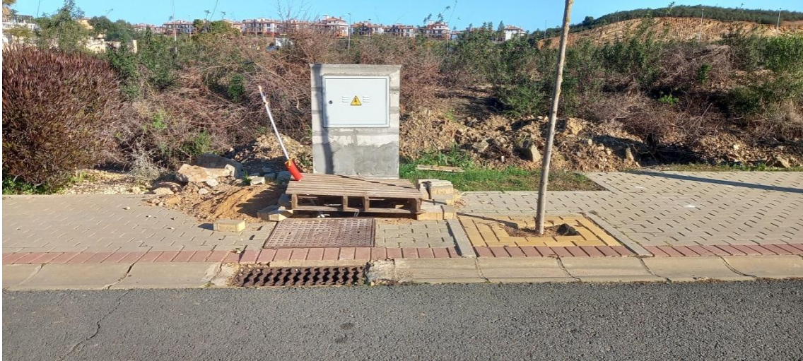
Arqueta eléctrica con peligro para peatones