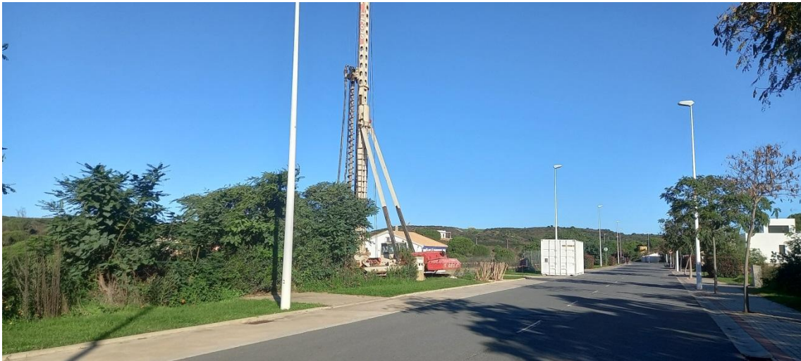
Caseta de obra en vial