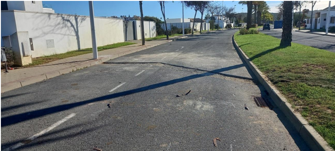
Regola de obra en asfalto