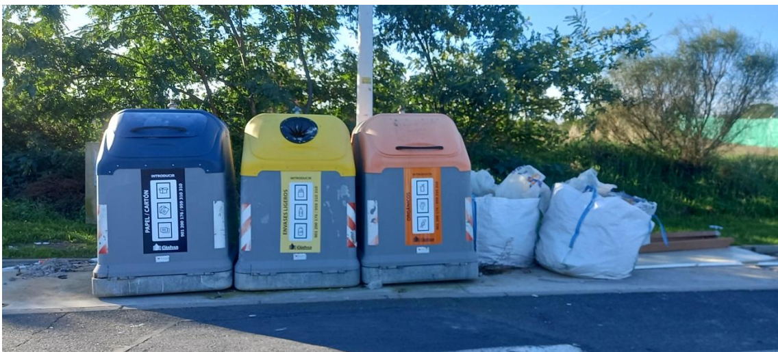
Escombros de obras en contenedores